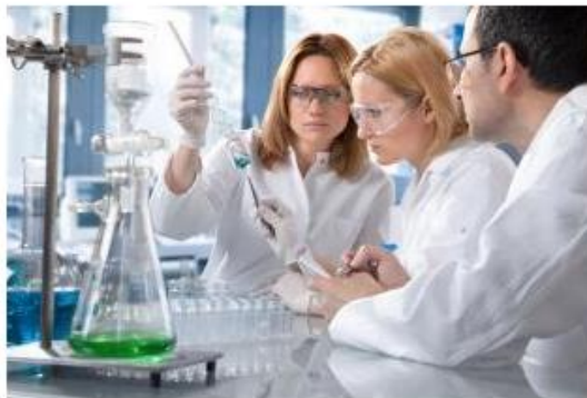
European Pact for Youth