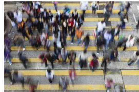
The Sustainable Business Exchange