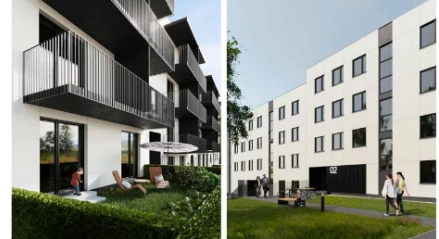
Zespół budynków mieszkalnych