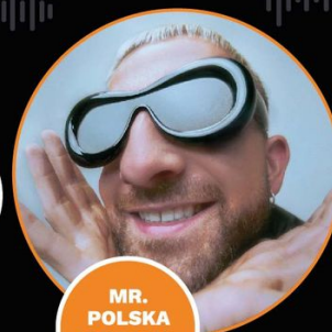
MR. POLSKA 2.09.2023 godz. 20:00

STREFA GASTRO STREFA PARTNERÓW MŁODZIEŻOWY ART PATROL STREFA AKTYWNOŚCI PARK ROZRYWKI