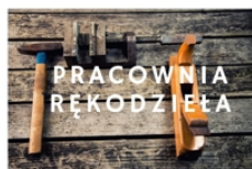
PROWADZI RADOŚLAW PŁUSA