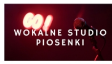
PROWADZI PIOTR MRÓZEK