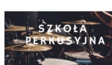
PROWADZI GRZEGORZ DZIAMKA