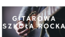
PROWADZI KRZYSZTOF STANIK