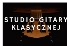
PROWADZI WALDEMAR DZIURA