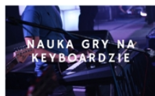
PROWADZI PIOTR MRÓZEK