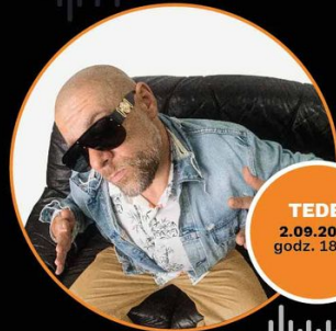
TEDE 2.09.2023 godz. 18:30