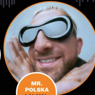
MR. POLSKA 2.09.2023 godz. 20:00

STREFA GASTRO STREFA PARTNERÓW MŁODZIEŻOWY ART PATROL STREFA AKTYWNOŚCI PARK ROZRYWKI