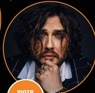
PIOTR CUGOWSKI 3.09.2023 godz. 19:00