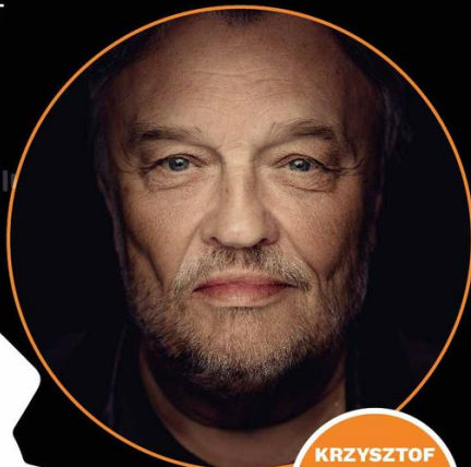
KRZYSZTOF CUGOWSKI z Zespołem Mistrzów 3.09.2023 godz. 20:30