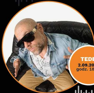
TEDE 2.09.2023 godz. 18:30